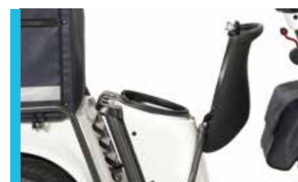
Coffre sous selle avec double prise USB 5V