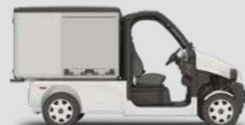
PULSE 4 - LONG