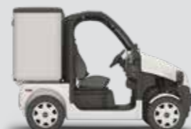
PULSE 4 - COURT