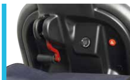
Frein parking avec blocage pendulaire