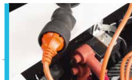
Charge sur prise domestique