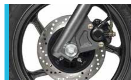
3 freins hydrauliques à disques ventilés